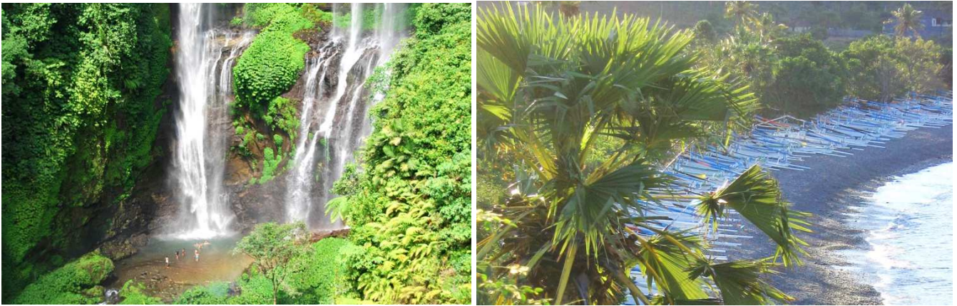
Die Wasserfälle Sekumpul ganz in unserer Nähe und die Buchten von Amed mit Hunderten von Booten

Neben Spaziergängen in der unmittelbaren Umgebung und neben Bootstouren können Sie mit einem unserer klimatisierten Autos unter sachkundiger Führung zahlreiche Insel-Ausflüge machen, die Sie in Ihrer Willkommensmappe thematisch geordnet und ausführlich beschrieben finden. In dieser Mappe beschreiben wir Ihnen zahlreiche Möglichkeiten, die über die hier genannten Touren, hinausgehen.