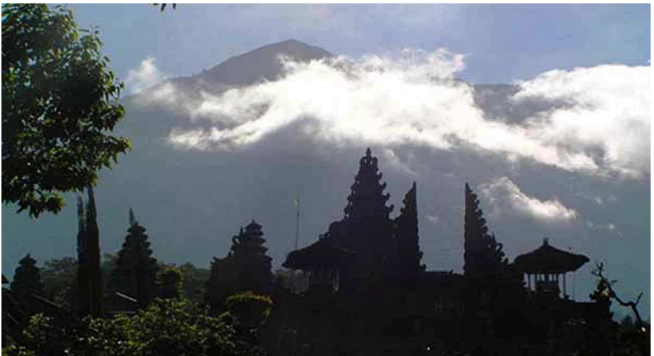
Die Silhouette des Baturtempels mit Blick auf den Gunung Agung

1. Berglandschaft und heisse Quellen: Eine beliebte Tour ist die Runde Singaraja – Bedugul/Bratansee – Munduk – Banjar – Lovina – CBG. Lassen Sie sich von Ketut oder Jersan berichten: von der kühlen Berglandschaft des Bratansees mit einem Tempelkomplex, einem farbenprächtigen Bergmarkt, und einem imposanten botanischen Garten, den Nelken- und Kaffeewäldern oberhalb des Dorfes Munduk, dem einzigen buddhistischen Tempel Brahmavihara Arama, den heißen Quellen in Banjar und dem etwas in die Jahre gekommenen Seebad Lovina.